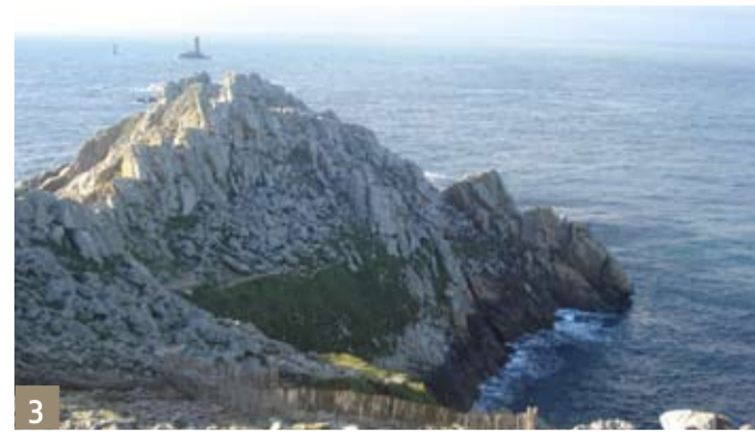
3 La Pointe du Raz - Plogoff