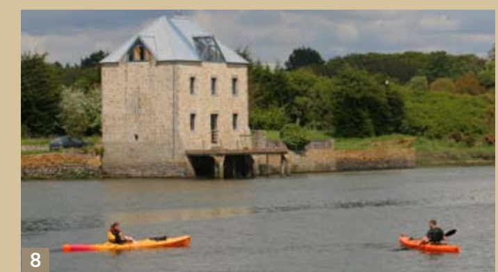
8 Balade en kayak sur la rivière de Pont-l'Abbé