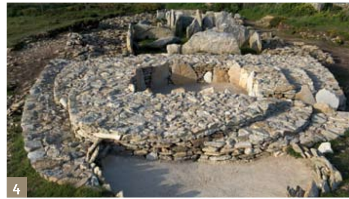
4 La Pointe du Souc'h - Plouhinec

POINTE DU RAZ / CAP SIZUN BAIE DE DOUARNENEZ PAYS BIGOUDEN