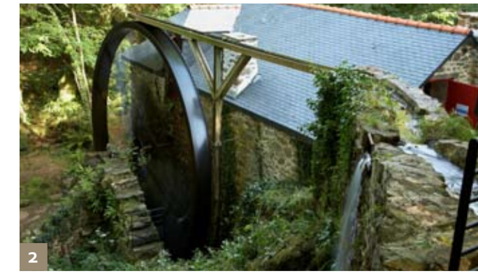
2 Le moulin de Kériolet - Beuzec-Cap-Sizun