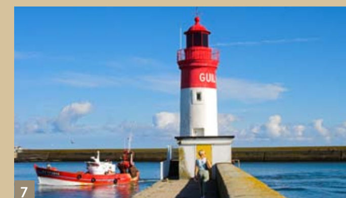
7 Le Guilvinec