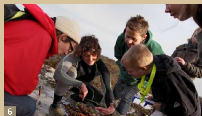
6 Découverte de l'estran - Penmarc'h