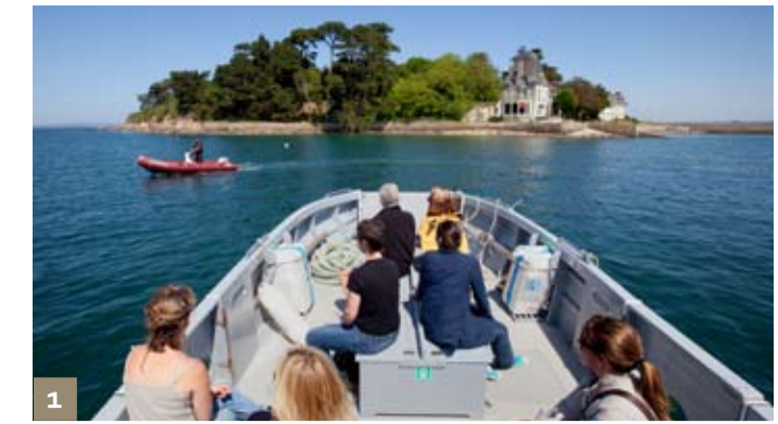
1 Ile Tristan - Douarnenez