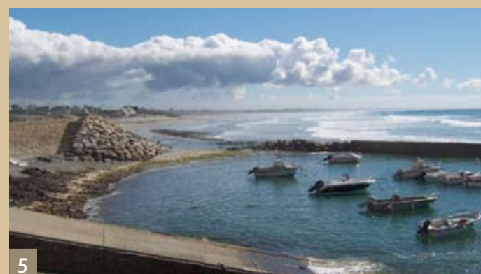
5 Penhors à Pouldreuzic en baie d'Audierne